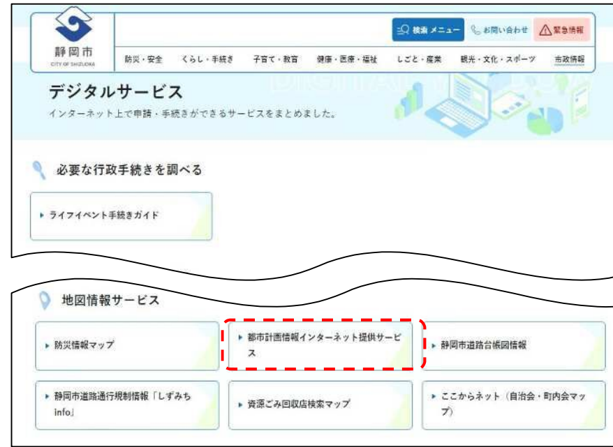
② 地図情報サービスの「都市計画情報インターネット提供サービス」をクリック。