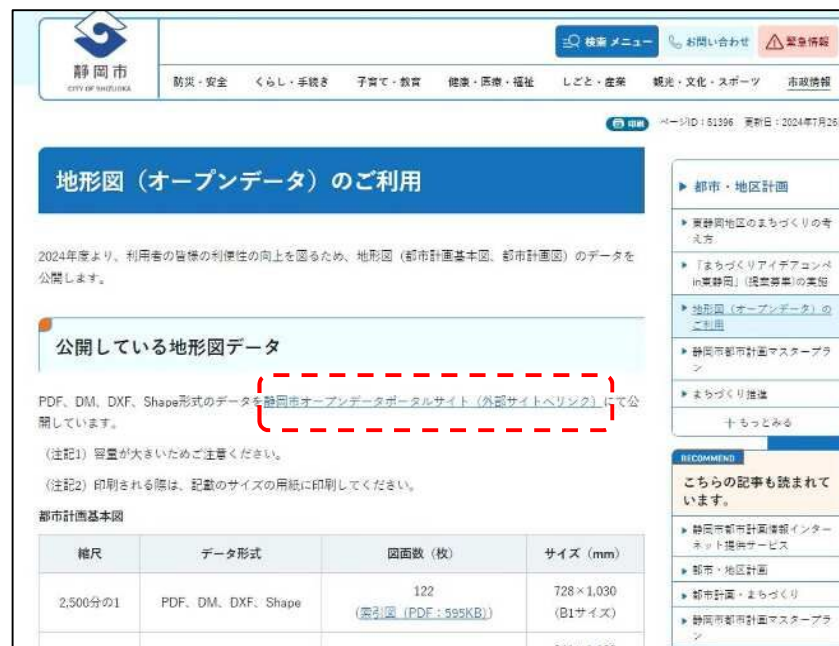
④ 青字になっている「静岡市オープンデータポータルサイト（外部サイトへリンク）」をクリック。