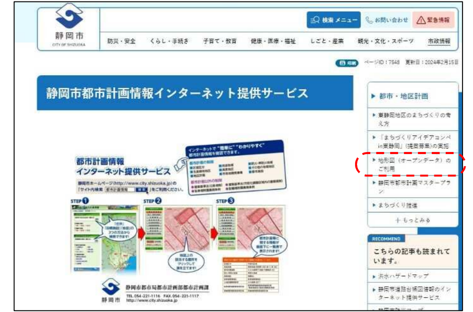
③ 「地形図（オープンデータ）のご案内」をクリック。