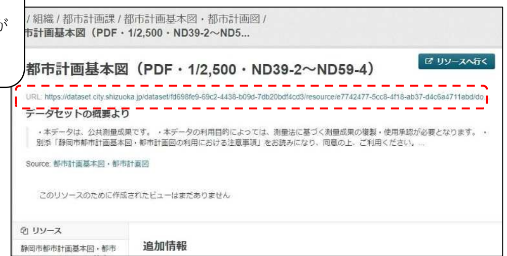
⑥ URLをクリックするとデータのダウンロードができます。