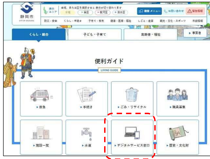
① 静岡市公式ホームページトップ画面から「デジタルサービス窓口」をクリック。