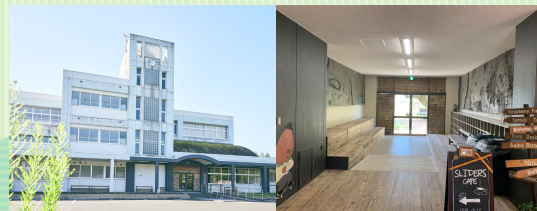
福知山市 THE 610 BASE