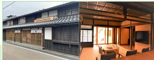
津山市 「城下小宿糺や」