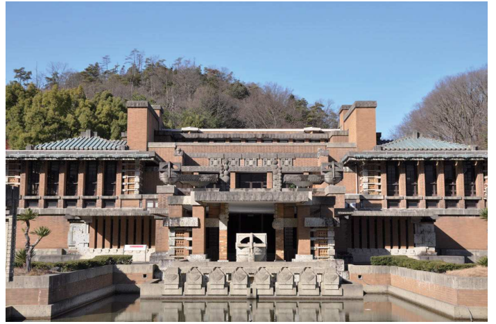
設計者：フランク・ロイド・ライト

2016年7月22日(金) 参加費：JIA会員 / 5,000- 非会員 / 6,000-