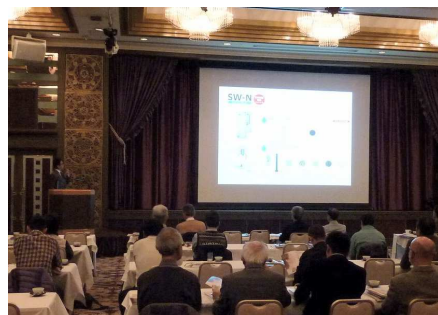
新技術講習会での説明風景

結びに、企画・構成・準備と貴重なお時間割いていただきました事業研修委員会の皆様方には置かれましてはお疲れ様でした。ご協力に感謝します。