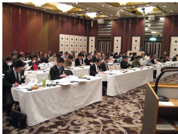
講習会 会場の様子