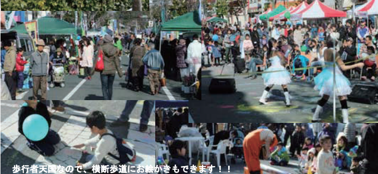
歩行者天国なので、横断歩道にお越しくもできます！！