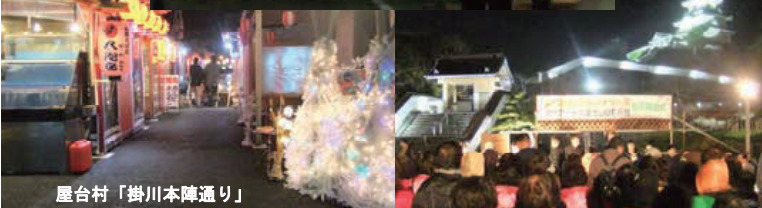
屋台村「掛川本陣通り」