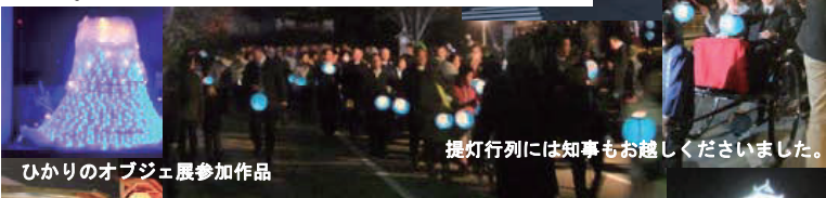
ひかりのオブジェ展参加作品