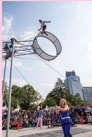
市民カメラマンの望月敏秀さんが撮影しました。