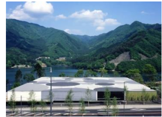
富弘美術館(設計 ヨコミソマコト)

■訪問場所(予定) 7日午前7:30静岡駅南口から出発し、8日午後9:45頃同所着予定です。