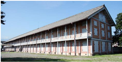
旧官営富岡製糸場(世界遺産)