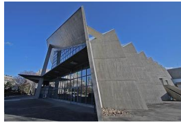
群馬音楽センター(設計 A・レーモンド)