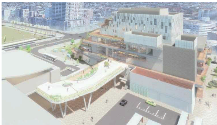
東静岡駅コンコースと図書館メインエントランス(3F)を直結するペDESTリアンデッキ