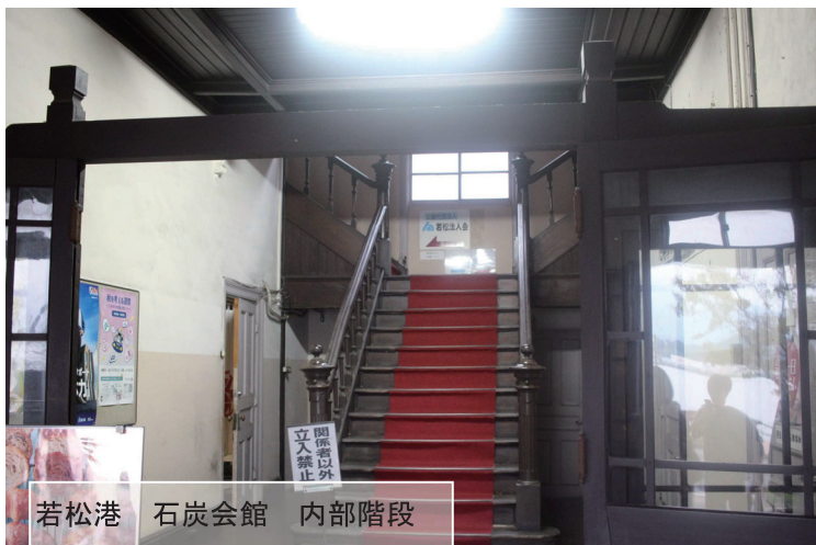
若松港 石炭会館 内部階段

ベースパック事業部 〒420-0035 静岡市葵区七間町 18-1 PIVOT 静岡 301 TEL:054-204-7282 FAX:054-204-7288 URL:http://www.b-pack.net/