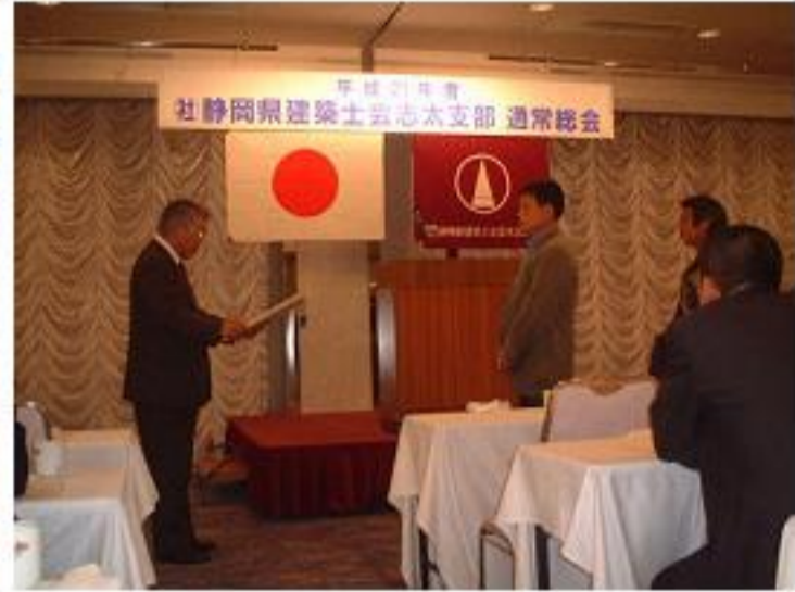
平成21年度志太支部通常総会議事録