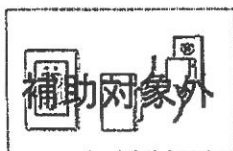
コンセントタイプ