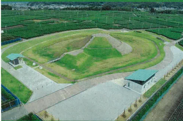
第16回 優秀賞（静岡県建築士会賞） 「茶畑に囲まれる和田岡古墳群」（掛川市）