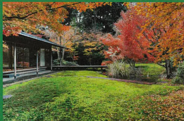
第16回 優秀賞（日本造園建設業協会静岡県支部賞） 「浜松市茶室 松韻亭」（浜松市中央区）