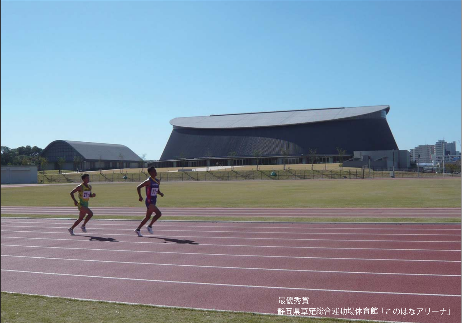
最優秀賞 静岡県草薙総合運動場体育館「このはなアリーナ」