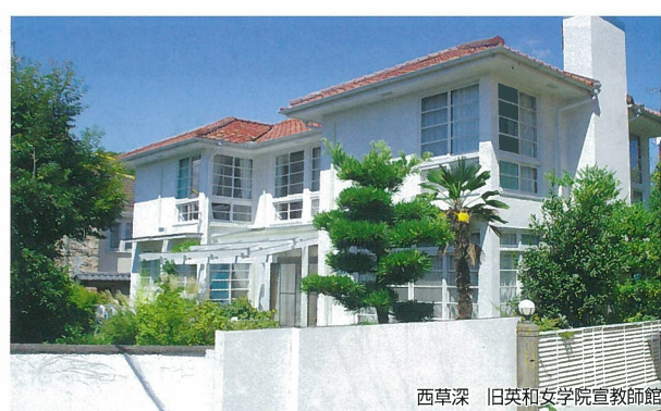
西草深 旧英和女学院宣教師館