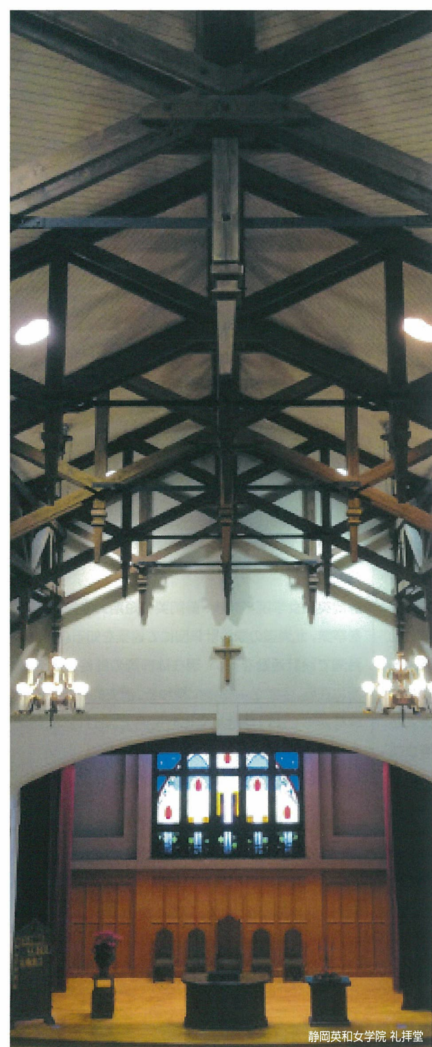
静岡英和女学院 礼拝堂