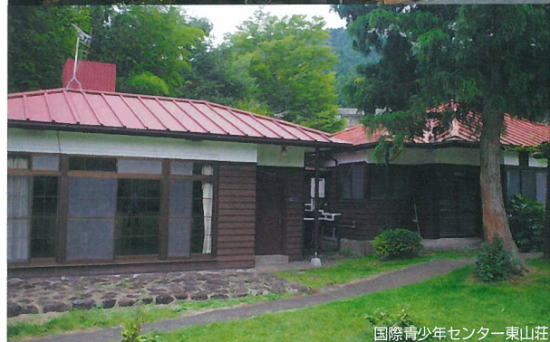
国際青少年センター 東山荘