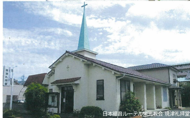
日本福音ルーテル栄光教会 焼津礼拝堂