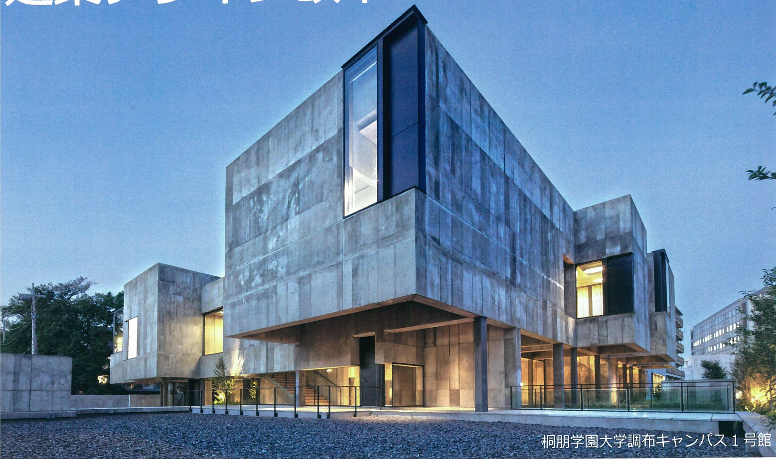
桐朋学園大学調布キャンパス1号館