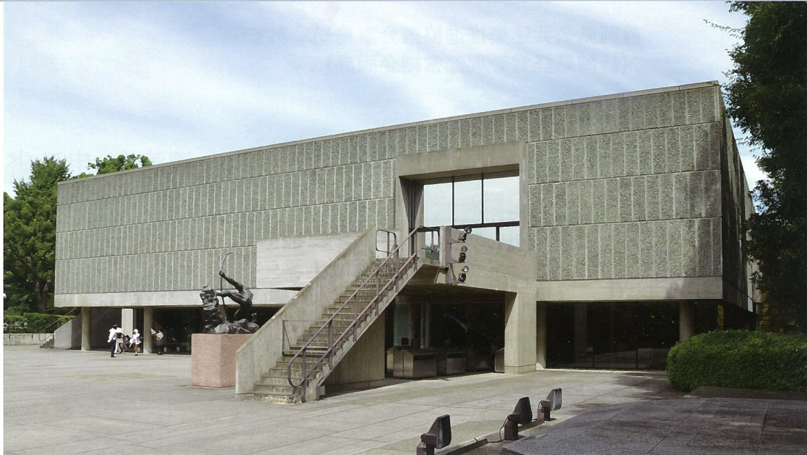
[ 写真：世界遺産 国立西洋美術館（ル・コルビュジエ設計） ]

多くの公共施設が更新時期を迎える中、建替え主体ではなく、建築物の長寿命化を図り、既存施設のストックを長期に活用することが課題となっています。