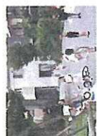
安心して遊べる道

学校から帰って小径にたどり着いた時に覚える安心感。この小径が団地の内と外を強く意識させてくれます。団地内の道路には通り抜けの車が入り込まないように工夫されています。スピード抑制のためのポテンシャルを設け、歩道がなくても街路樹を植えることが可能になりました。クルドサックはこどもの広場です。