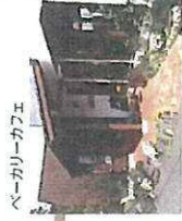
パーカーカーフェ